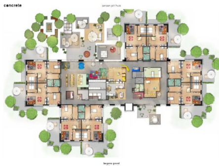
(boven aanzicht Het Jeroen Pit Huis door concrete)