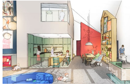
(schetsontwerp van de leefkeuken)

De 8 appartementen en de meeste gemeenschappelijke faciliteiten zullen gelegen zijn op de begane grond. Daarnaast zullen een aantal ondersteunende diensten gesitueerd worden op een bovenverdieping. Hierdoor zal het gebouw 'anderhalf laags' zijn; geen platte kliniek maar ook geen hoogbouw. Al met al zal Het Jeroen Pit Huis een vriendelijke en toegankelijke uitstraling hebben en zo min mogelijk doen denken aan een ziekenhuis. De totale oppervlakte zal circa 1.600m 2 bruto vloer oppervlakte bedragen.