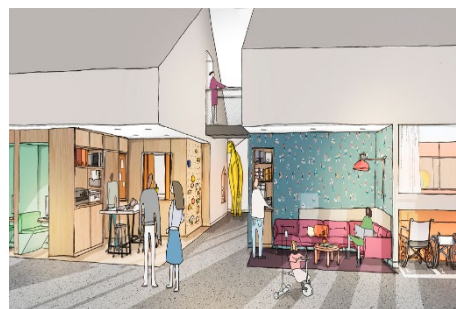
(schetsontwerp van het entree)