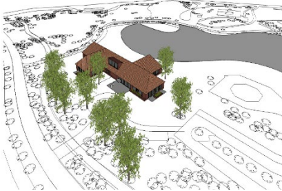
(Het Jeroen Pit Huis exterieur)

In samenspraak met ervaringsdeskundige ouders en zorgverleners is een programma van eisen voor Het Jeroen Pit Huis opgesteld. Op basis van dit programma is samen met architectenbureau Brique een inventarisatie gemaakt van de benodigde faciliteiten en functies. Het voorlopig ontwerp van het huis is gereed en zijn ze bezig aan het definitieve ontwerp. Gerenommeerd bureau concrete is bezig met een voorlopig ontwerp. Een impressie van Het Jeroen Pit Huis is hiernaast/hieronder getoond.